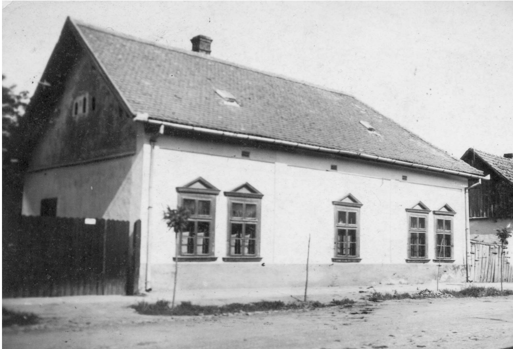
Magyar Kir. Állami Óvoda épülete 1940 körül...