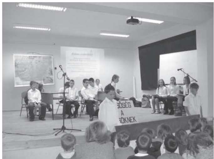
Október 23-i megemlékezés