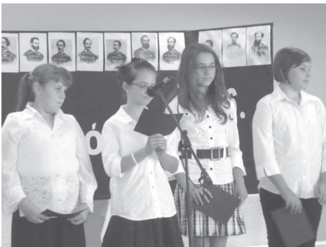
Megemlékezés az aradi vértanúkról